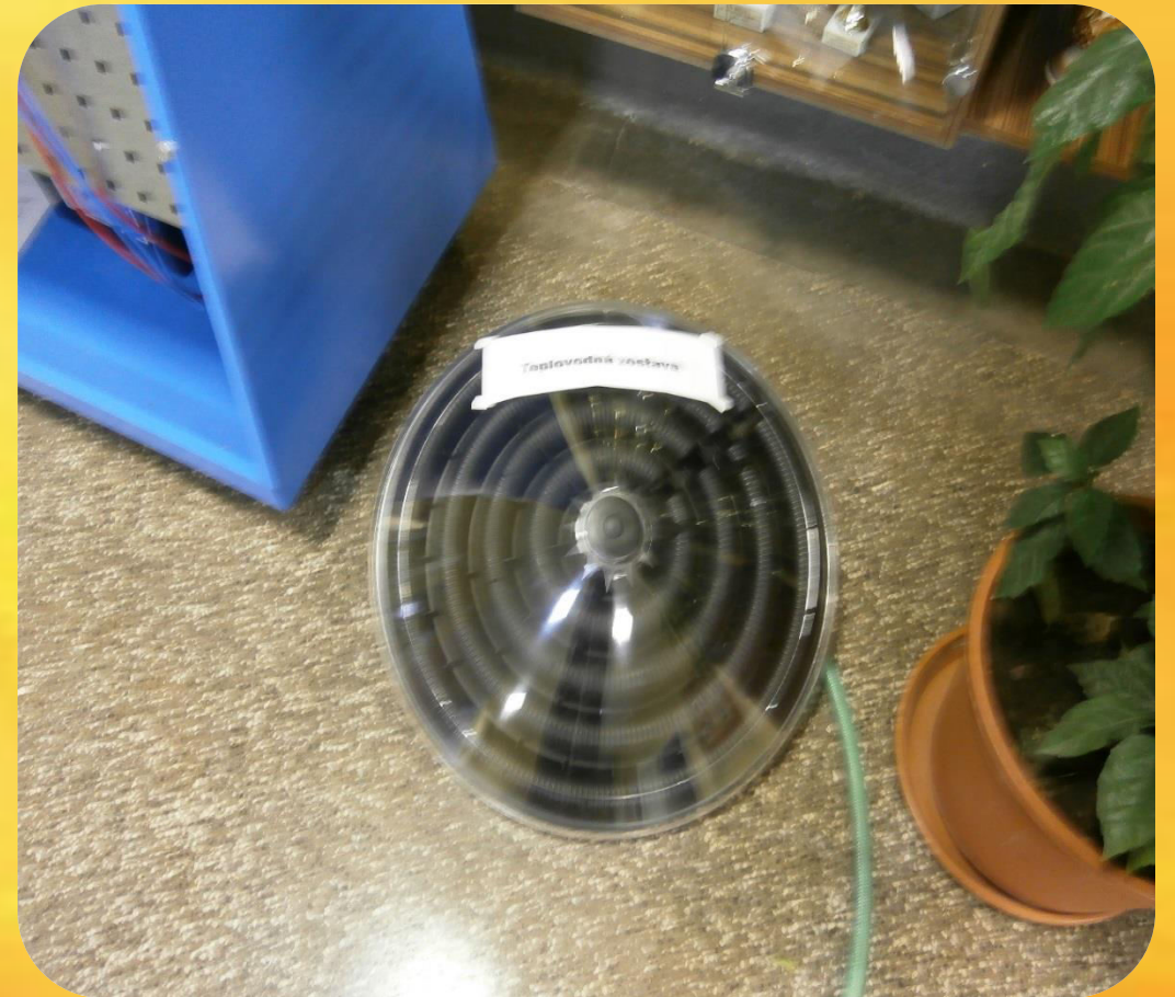
Fotovoltaická a teplovodná zostava