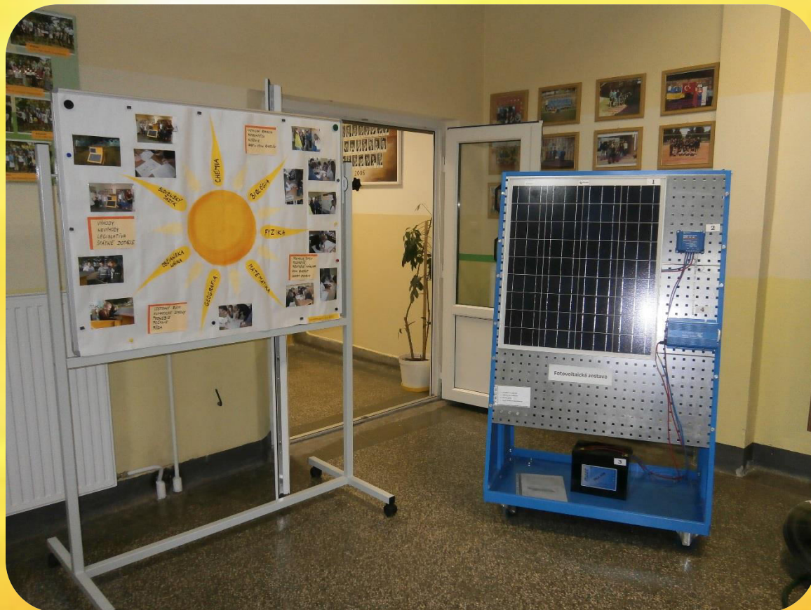
Fotovoltaická zostava a informačný panel